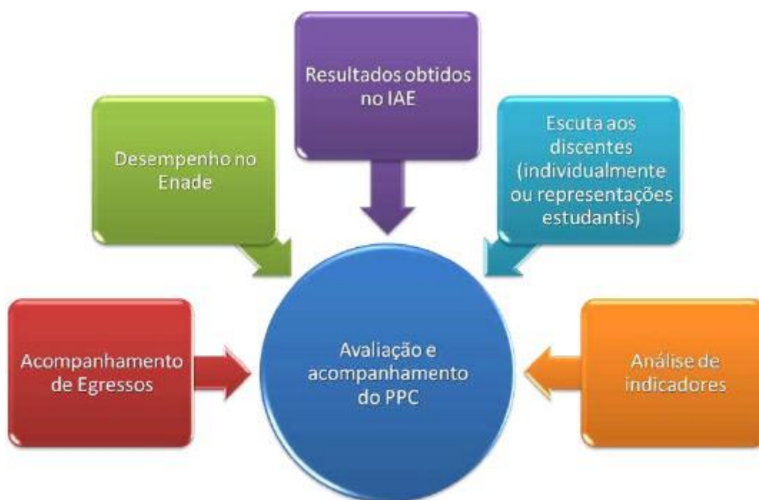
Figura 6 - Estratégias para desenvolvimento do processo de avaliação e acompanhamento do Projeto Pedagógico do Curso de Engenharia de Produção.

A Figura 6 apresenta as estratégias a serem utilizadas para desenvolvimento do processo de avaliação e acompanhamento do Projeto Pedagógico do Curso de Engenharia de Produção na UFVJM.